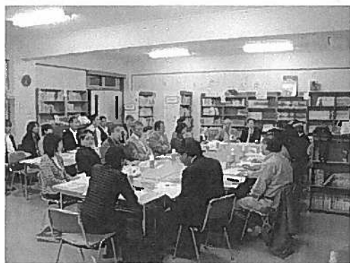
第一回部会のようす (平成23年5月18日)

そこで、わたしたち「かみいけ♡いけほんつながり隊地域文教部会」では、地域、保護者、学校、豊島区、教育委員会等の関係者が協働しながら「地域版建設構想」を作成し、区へ提言していくこととし、去る5月18日（水）に第一回部会を開催しました。