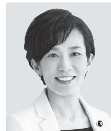
やまもと 山本 かなえ 現 役職:元厚生労働副大臣。 参院議員3期。 経歴:京都大学文学部卒。 年齢:48歳 「あなたの声を、かなえるチカラ。」