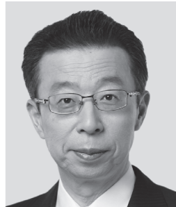
はまの よしふみ 浜野 よしふみ 参議院議員 現職 まっすぐに力強く! 働く仲間のために!