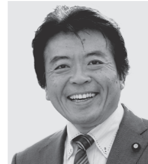
弁護士 仁比そうへい 現 55歳。参院議員2期。党参院国対副委員長。 活動地域 中国、四国、九州・沖縄