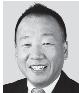
おshima くすお 大島 九州男 参議院議員 現職 平和憲法の精神を守ります