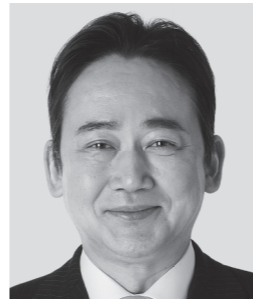
いしがみ としお 石上 としお 参議院議員 現職 全力で聴く。全力で届ける。全力で挑む。