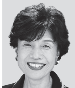
えのみや よりよ 円 より子 元参議院議員 元職 世直しおぼあ、子育て世代全力応援