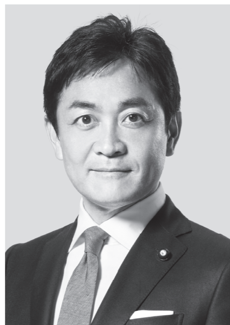
国民民主党 代表 玉木雄一郎