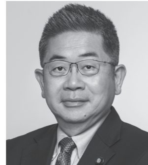
党書記局長 小池 晃 現 59歳。参院議員3期。全国革新懇代表世話人。医師。 活動地域 東京