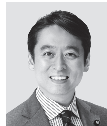
ひら 平木 だいさく 現 役職:元経済産業大臣政務官。 参院議員1期。 経歴:東京大学法学部卒。 年齢:44歳 未来をひらく 確かな実力!