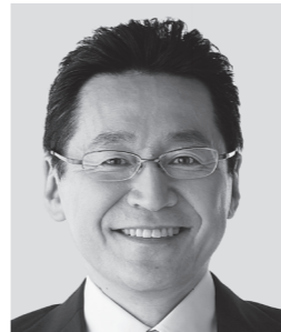
てつじ いそざき 哲史 いそざき 哲史 参議院議員 現職 仲間の思い、かたちにしたい。