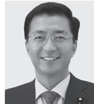
党副委員長 山下よしき 現 59歳。参院議員3期。 活動地域 大阪、兵庫、滋賀、奈良、和歌山