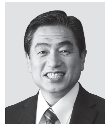
わかまつ 若松 かねしげ 現 役職:元復興副大臣。参院議員1期。 経歴:中央大学二部卒。公認会計士。 税理士。行政書士。 年齢:63歳 「現場第一」で復興・防災に全力