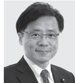
党参院幹事長・国対委員長 井上さとし 現 61歳。参院議員3期。 活動地域 東海、北陸信越、京都