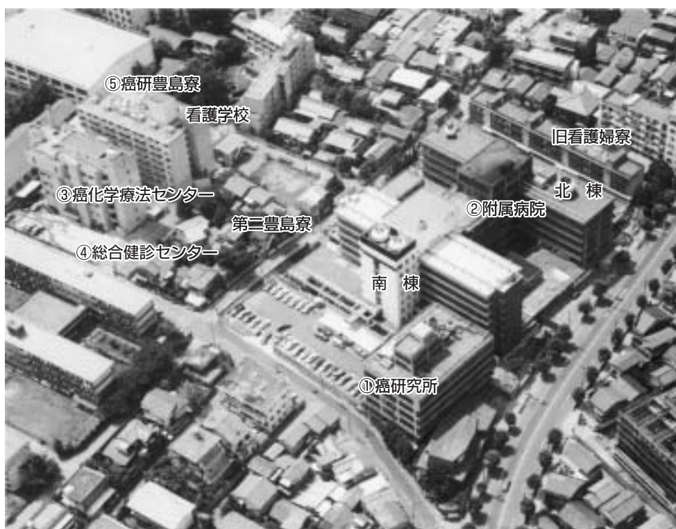
現在の癌研究会施設の全容